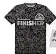
เสื้อ FINISHER สำหรับ half marathon และ triathlon VIP